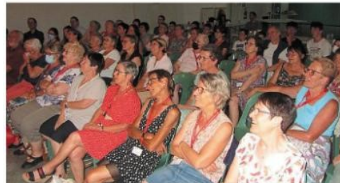
La rencontre des bibliothécaires bénévoles du réseau Arentelle s'est achevée avec le spectacle de l'humoriste Titus intitulé « Les dangers de la lecture ».

Les bénévoles du réseau des bibliothèques font le point