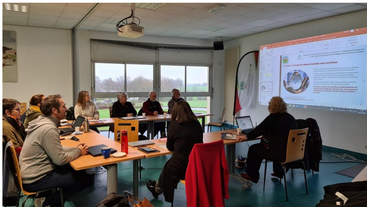
Membres du comité technique, réunis le mardi 10 janvier 2023

Depuis, un comité technique se réunit régulièrement afin d'établir en concertation, les enjeux et les objectifs du réseau de lecture publique « Arantelle » . Un comité de pilotage composé de la Direction Régionale des Affaires Culturelles, du Département, et du Président de la Communauté de communes et son vice-président en charge du Pôle Qualité de vie, valide les orientations du comité technique à chaque étape.